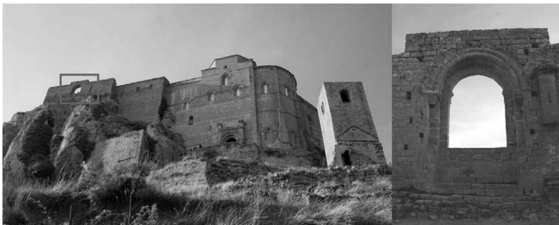
Fig. 1: Castillo de Loarre (Huesca). Frente meridional de la fortaleza y Mirador de la Reina desde el interior del recinto.

ante el Papa la infeudación del reino a la Santa Sede. Con Aragón convertido en vasallo de San Pedro, cualquier reclamación navarra sobre los territorios pirenaicos quedaba vacía de contenido 7 . Esta alianza, ventajosa para ambas partes, será la clave para entender las principales actuaciones emprendidas por el monarca en los siguientes años, incluida la sustitución del antiguo rito hispano por la liturgia gregoriana (1071) 8 y su matrimonio, en segundas nupcias, con Felicia de Roucy, hermana del paladín papal Eblo de Roucy.