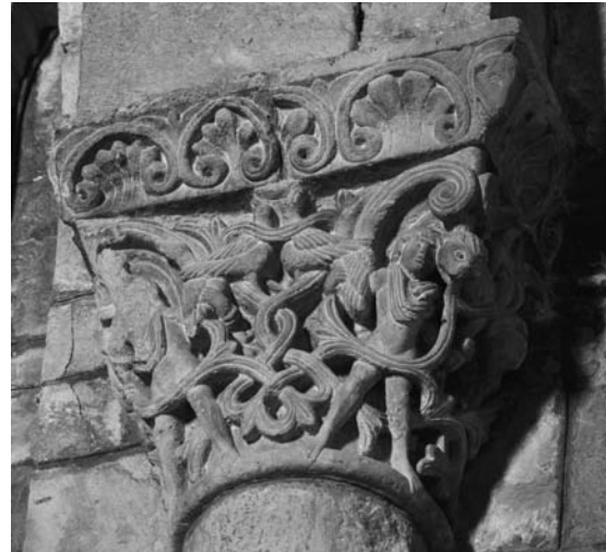
Fig. 7: Catedral de Jaca (Huesca). Interior, jóvenes entre maraña vegetal.

así como de otros en los que el difunto, en imago clipeata , es elevado al cielo por genios alados, puesto que su conocimiento por parte del escultor jaqués es innegable a la luz de capiteles como el del Sacrificio de Isaac , o el de la evocación del alma santificada elevada al cielo en el interior de la catedral; cestas en las que el tallista no tuvo sino que reactualizar las antiguas composiciones moralizando los significados, dando lugar a piezas formalmente próximas al modelo, pero radicalmente distantes en cuanto a contenido.