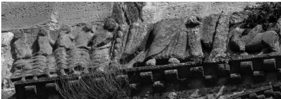
Fig. 5: Castillo de Loarre (Huesca). Friso sobre la portada de acceso.