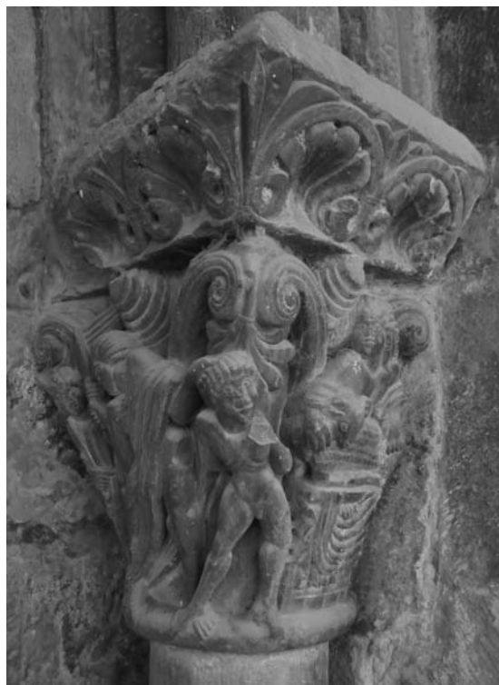
Fig. 4: Catedral de Jaca (Huesca). Portada meridional. Sacrificio de Isaac.

Aún más que la arquitectura, la escultura hará patente las novedades románicas. La plástica anterior apenas cuenta con otros precedentes que el conocido relieve real de Luesia (ca. 975), así como el conjunto procedente de la iglesia de San Miguel de Villatuerta, hoy en el Museo de Navarra (último cuarto del siglo X). El primero, estudiado por Cabañero y Galtier, es un fragmento de arenisca que muestra la representación de un monarca con corona, indumentaria militar y portando cruz procesional 22 . Los segundos, diez recuadros conservados, incluyen aves, cuadrúpedos, un espinario, un ángel, un crucificado, un personaje de brazos alzados en actitud orante, un obispo a caballo y una escena litúrgica integrada por dos eclesiásticos, reflejo del antiguo ordo hispano quando rex cum exercitu ad prelium egreditur , según supieron advertir S. Silva y J. Martínez de Aguirre 23 . Si bien el mensaje de