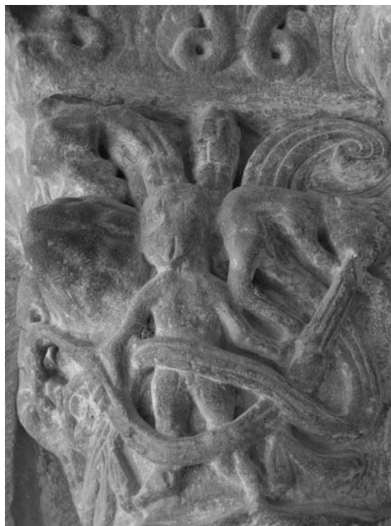
Fig. 8: San Martín de Uncastillo (Zaragoza). Capitel de la portada meridional.

Sin embargo, habría que matizar el concepto de “éxito” si nuestro punto de atención torna hacia el clasicismo escultórico que nos ha ocupado en páginas precedentes, aspecto en el que su alcance fue mucho más limitado. Realmente, si escapamos del dominio del “románico oficial”, apenas se puede rastrear su eco salvo en el capitel de la jamba izquierda de la ya referida portada sur de San Martín de Uncastillo, en lo que se nos antoja una síntesis o reelaboración de distintas cestas jaquesas. En una de sus caras no es difícil advertir aún la presencia de una figura humana desnuda de anatomía aceptablemente modelada, con los brazos extendidos y las piernas abiertas en compás, cuyo cuerpo aparece rodeado por una maraña de tallos ondulantes que trata de asir con las manos y que brotan de la boca de un felino colocado en la parte superior (Fig. 8). Mientras que el personaje remite tanto al Isaac del ingreso sur jaqués, como al protagonista del capitel de temática marina del interior de la catedral (progenie confirmada por la presencia de un abultado pitón que se proyecta desde el ángulo), tanto el motivo del elemento vegetal sinuoso, como su origen en las fauces de la bestia están más próximos al que remata la columna adosada al muro, junto a la embocadura del