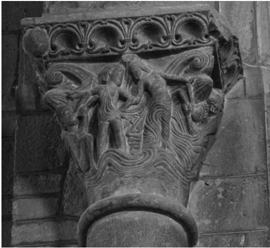
Fig. 6: Catedral de Jaca (Huesca). Interior, capitel marino.